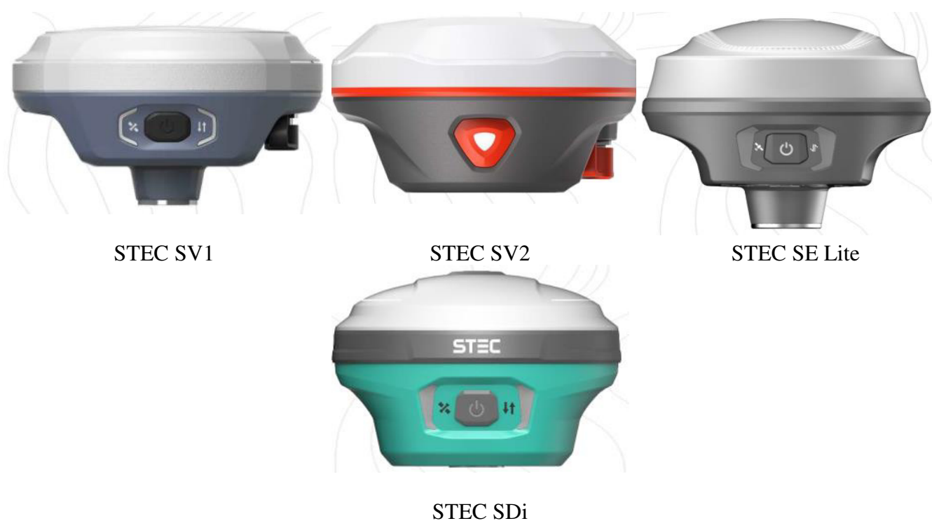
Рисунок 1 – Общий вид аппаратуры

Условия эксплуатации аппаратуры не обеспечивают сохранность знака поверки в течение всего рекомендуемого интервала между поверками при нанесении его на корпус аппаратуры.